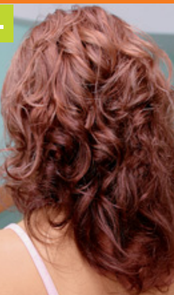
6. ÚČES ZAFIXOVALA, DODALA MU LESK POMOCOU GÉLU VO FORME KRÉMU PRAMENĽ PO PRAMENI.