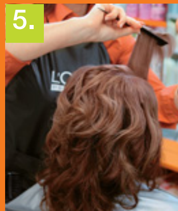
5. PO USCHNUTÍ KADERNÍČKA NATÁČKY Z VLASOV VYBRALA, OFINU JEMNE NATUPIROVALA.