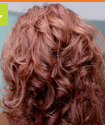
6. ÜCES ZAFIXOVALA, DODALA MU LESK POMOCOU GÉLU VO FORME KRÉMU PRAMEN PO PRAMENI.