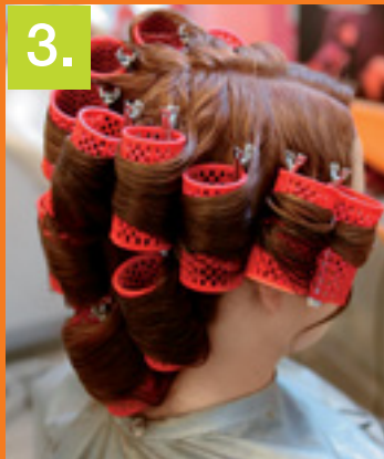
3. PO ZMYTÍ MELIROVACÍCH FARIEB VLASY NATOČILA, A ABY VLNY PŮSOBILI BOHATO A PRIRODZENE, NATÁČKY APLIKOVALA ZVISLO PÄR CENTIMETROV OD KORIENKOV.